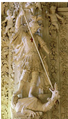
Capilla de San Jorge. La Seo, catedral donde se coronaban los reyes de Aragón. Zaragoza.

Volviendo a la presencia casi fantasmagórica de San Jorge luchando contra los musulmanes en tierras ibéricas, volvemos a encontrarlo en otras crónicas medievales: aparece luchando con muchos otros "caballeros del Paraíso" en la conquista de Valencia, y también en Mallorca donde al primero que vieron entrar en liza fue a "un caballero blanco con armas blancas", según noticias transmitidas por el propio rey Jaime I d'Aragón, quien termina confesando que "en otras batallas lo han visto muchas veces cristianos y sarracenos".