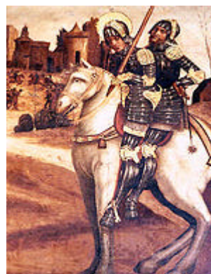
Iglesia de la Merced. Teruel

Esta es la leyenda que se difundió con fuerza con ocasión de la Batalla de Alcoraz, en la ciudad de Huesca, en el año 1096. En este lugar hace su aparición triunfal el Señor San Jorge dotado de todos y cada uno de los elementos de la leyenda tradicional del dragón, salvo el dragón: viene montado sobre su caballo blanco, llega desde tierras orientales, de Antioquía concretamente, acompañado por un cruzado que monta en la grupa, portando el estandarte de la cruz roja sobre sus vestiduras blancas de caballero cruzado, y corta la cabeza no de un dragón, sino de cuatro reyes moros que a partir de entonces adornarán los cuatro ángulos de la cruz de San Jorge. Viene San Jorge para ayudar al rey Pedro I