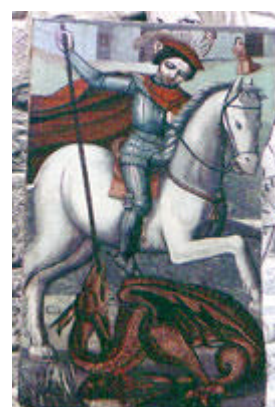
Museo de Jaca (Huesca)

Cuando surge la leyenda de San Jorge lo hace a partir de sustratos legendarios mesopotámicos y sumerios, en los que el dragón era una presencia habitual, el caos primigenio del que surge el universo tras la intervención del héroe, o el monstruo al que hay que dominar para restituir la presencia del sol y de los astros. Cuando los cruzados encuentran la leyenda del dragón en el contexto cristiano, la hacen suya, y la trasladan desde Siria a occidente. Aquí, el dragón termina siendo el enemigo, cualquier enemigo.