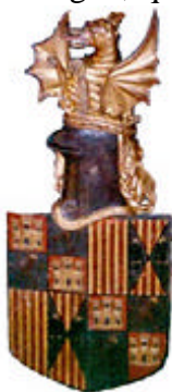
Cimera de los reyes de Aragón en la techumbre mudéjar del Palacio de la Aljafería (Zaragoza)

a terminar lo que su padre dejó inacabado cuando murió luchando en la batalla por la conquista de Huesca. A partir de este momento, el rey de Aragón y sus caballeros se manifiestan bajo la protección y el patronazgo de San Jorge, y según la creencia según la cual el héroe adquiere la fuerza del monstruo destruido, los reyes de Aragón utilizan como cimera cabezas de dragones alados, y, muy posiblemente, alardean de que la palabra Aragón, asumida como una especie de apellido de la familia real, es la misma que D'Aragon, que al oído suena igual que dragón. Por lo tanto, por su figura y su nombre, el rey de Aragón pasa a ser conocido como el Rey Dragón. Esta situación es paralela a la que se vive en Britania, donde la casa real es la casa Pendragón o Pandragón. En la Corona de Aragón, de vuelta a la península y abundando en las coincidencias, nos encontramos con que una de las ciudades portuarias claves para la conquista del Mediterráneo es Tarragona, cuyo topónimo puede traducirse por estragón, planta llamada dragón en otras lenguas, y de la misma raíz etimológica, aunque en España e Inglaterra deriva del griego drakoon por medio de la palabra árabe tarkhun. El estragón, según creencia medieval, era una planta que alejaba y protegía de los dragones.